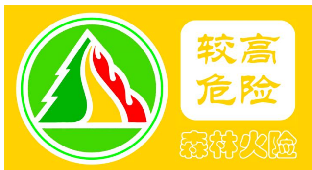
图2 森林火险黄色预警信号标识

(三) 森林火险黄色预警信号表示：未来一天至数天预警区域森林火险等级为三级，林内可燃物较易点燃，较易蔓延，具有较高危险。预警信号标识的底色和文字采用黄色，表示危险程度的文字为：较高危险。